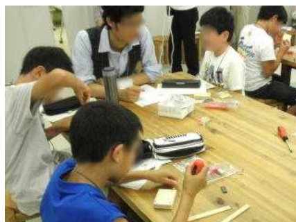
大学生のお兄さんにも教えてもらって工作をする