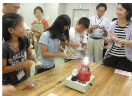
大学生のお姉さんに励まされながら手回し発電機を1分間回し続ける