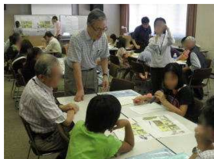
エコライフ「ちがいがい探し」の 答え合わせ