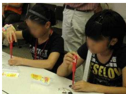
ドライバを使ってソーラー オルゴールの組み立て