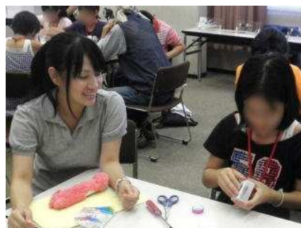
大学生のお姉さんと一緒にソーラー オルゴールのケースにお化粧