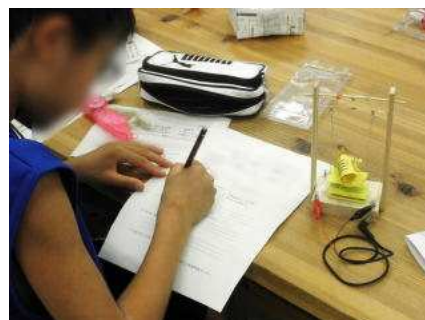
完成した電気ブランコを前に、感想を書く参加者