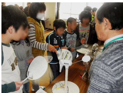
風力発電の実験はいつでも大人気