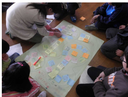
省エネ実践についてワークショップ