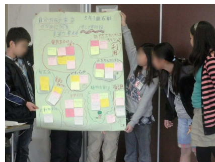
ワークショップの成果発表