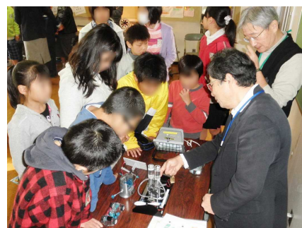
燃料電池の話は少し難しい