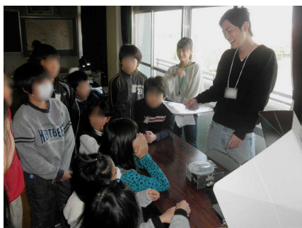
ソーラークッカーの説明を聞く