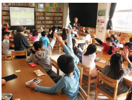
図書室に集まって元気に授業開始

日本人は自分の意見を主張するのが下手と言われていますが、環境問題に限らず、このようなワークショップを体験したことが、子どもたちの経験として将来、何かに役立つことを期待しています。