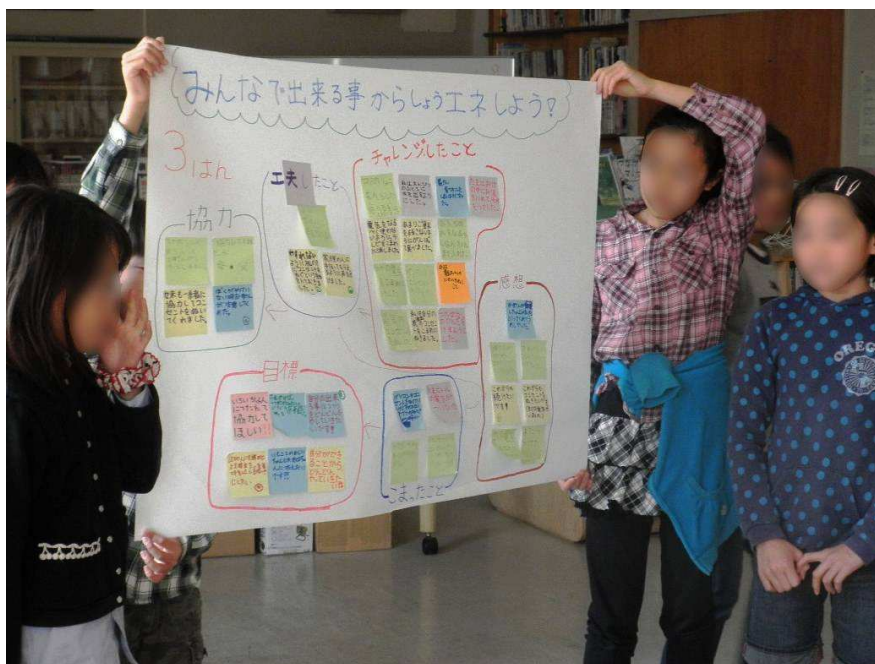
ワークショップで話し合ったことを各班1~2分で発表