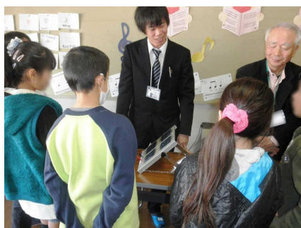
太陽光発電の説明を聞く