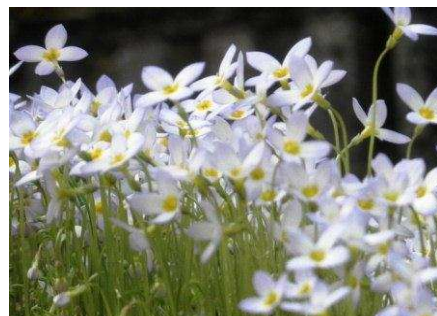
トキワナズナ (輪王寺)