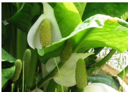
ミズバショウ (日光植物園)