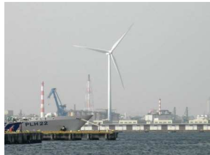
象の鼻パークからは遠くに ハマウイングの風車も見える