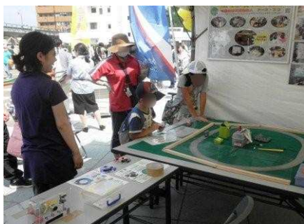
アース・エコのブースで 手回し発電を体験

今年は会場に恵まれたせいか、例年にも増して多くの子ども連れの家族が来場し、アース・エコのブースに2日間で120人も子どもたちが立ち寄り、電車の競走を楽しんでいきました。大人向けに準備した節電を呼びかけるチラシも早々となくなるほどの盛況でした。