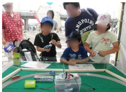
太陽光で走る赤い電車を追い越そう と青いトーマスを走らせる子どもたち