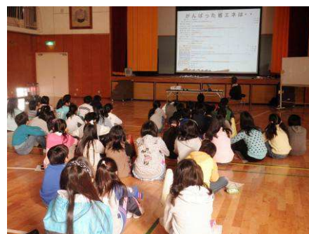
平成 22 年度出前授業の様子