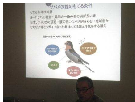
「つばめの夫婦にかくされた秘密」の発表

つばめは今が繁殖・子育てのシーズンですが、雄・雌それぞれの繁殖戦略と「うわき」について、日本野鳥の会のメンバーでもある会員から興味深い話がありました。