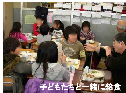
子どもたちと一緒に給食