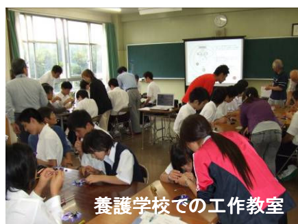
養護学校での工作教室

神奈川県、横浜市の出前授業で合計約800人の児童・生徒に会った計算になります。新型インフルエンザの影響で、一部の学校の実施日が急きょ延期になるハプニングもありました。参観日に授業を行った学校も2校あって、保護者の方ともお話しする機会がありました。給食をごちそうになった学校もあって、授業とは違った雰囲気の子どもたちに接することができました。