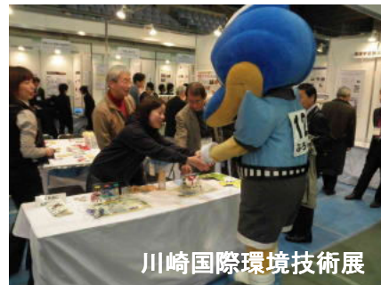
川崎国際環境技術展

さんに報告しました。ホームページをご覧いただいた外部の方からメールで24件ものお問合せやご依頼をいただきました。