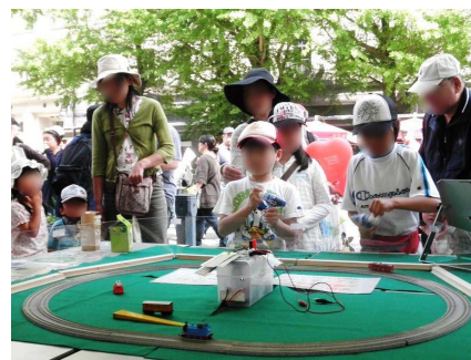
普及啓発 アジェンダの日2010