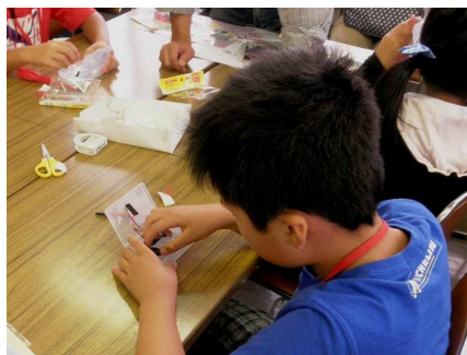
地域環境学習の工作教室