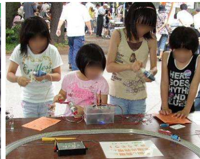
昨年の「さがみはら環境まつり」