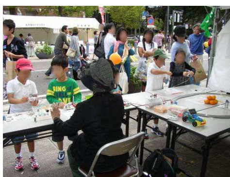
昨年秋の「アジェンダの日 2009」