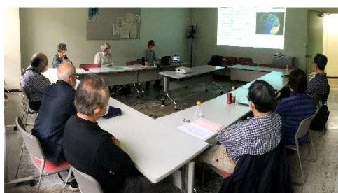
会議室で参加された皆さん

4月28日(水)、4月理事会・例会をかながわ県民センター会議室+オンラインで開催し、会員など11名が会議室で、7名がオンラインで参加しました。