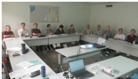
コロナ前の2019年開催の通常総会の様子