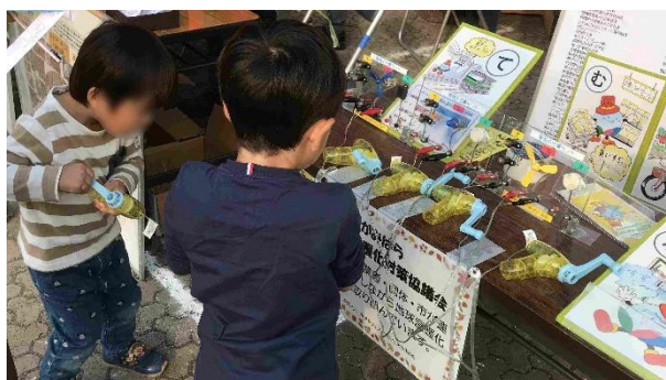
小さい子どもたちは手回し発電機が大好き

11月5日(日)、相模原市の淵野辺公園で、さがみはら市民活動サポートセンター主催の「さがみはら市民活動フェスタ 2023」が開催され、さがみはら地球温暖化対策協議会がブース出展しました。アース・エコは団体会員として出展に協力しました。