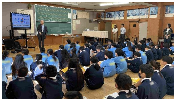
音楽室に集まった80名の生徒

講演のテーマは「SDGs 目標13:気候変動に具体的な対策を」です。SDGs は地球規模の広範な課題に対して17の目標を掲げていて、全体を理解するのは簡単ではありません。担当の先生と相談した結果、SDGs について知識を深めるより、気候変動を自分事としてとらえ、自分たちに何ができるか考えてもらうことにしました。