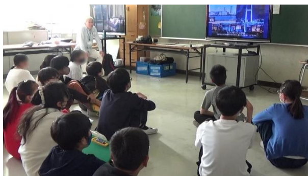
10年目を迎えた出前授業

11月2日(木)、横浜市青葉区内の小学校で6年生3クラス88名を対象に、「かながわ環境教室～実験・ゲーム で挑戦！地球温暖化防止～」を開催しました。参加した講師・スタッフは7名です。