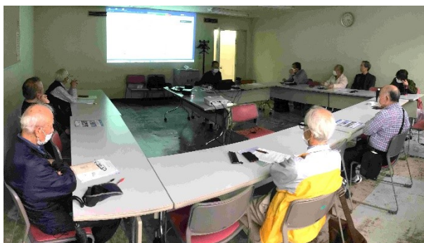
会議室にお集まりの皆さん(パノラマ写真)

4月24日(水)、会議室(かながわ県民センター)主体+オンライン(Zoom)で4月理事会・例会を開催しました。参加者はアース・エコ会員が12名(内オンライン参加者3名)、オブザーバー5名(内オンライン参加者2名)の計17名でした。