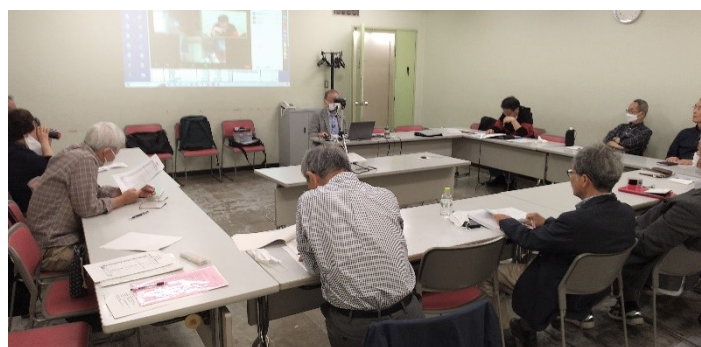
昨年度の通常総会の様子