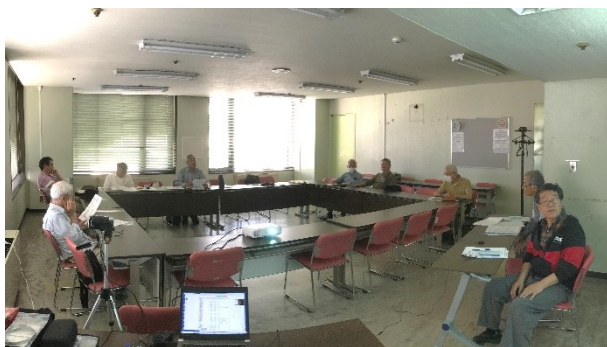
当日会場で参加した皆さん

5月29日(水)、かながわ県民センター会議室+オンラインのハイブリッド形式で、アース・エコ令和6年度通常 総会を開催しました。出席したのは正会員12名がで、うち1名はオンラインでの出席です。更に2名から議決権行 使書(いずれも全議案に賛成)が提出され、これにより14名が出席扱いとなり、会員総数20名の過半数となる11 名を超えたため、総会が成立しました。