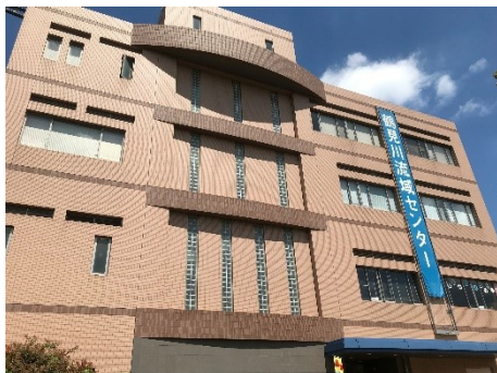
鶴見川流域センター