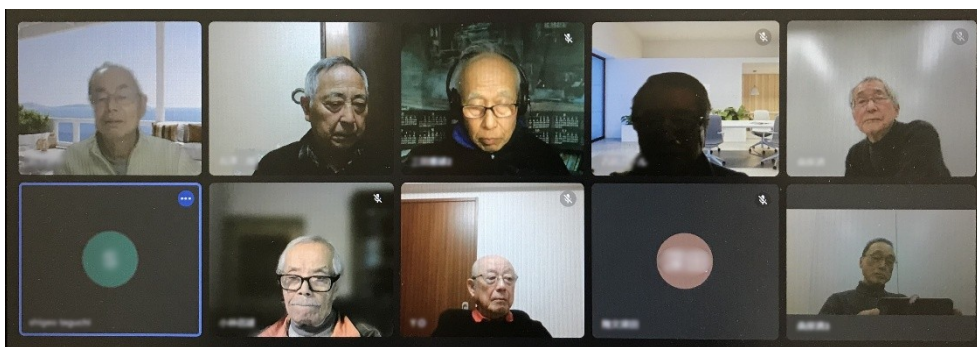
参加者の皆さん(Google meetの画面から)

3月5日(水)、2月理事会・例会・合同勉強会をオンライン(Google meet)主体+会議室(ユニコムプラザさがみはら)で開催しました。2月例会ですが都合により3月に入ってから開催です。参加者はアース・エコ会員7名(うち会議室参加者2名)、オブザーバー5名の計12名でした。1月例会に続き、Google meetによる開催です。