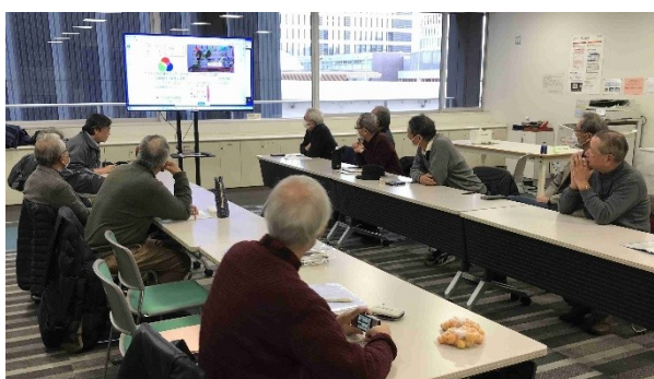
フクシア団体交流室で開催した例会

勉強会は、これから開催する3月を除き、対面+オンラインのハイブリッド、またはオンラインで毎月1回、計11回開催しました。毎回会員12~18名が参加し、相互啓発や意見交換をおこないました。会員からの報告・発表は15件ありました。勉強会は環境学習リーダー会エネルギー部会と共同開催しました。