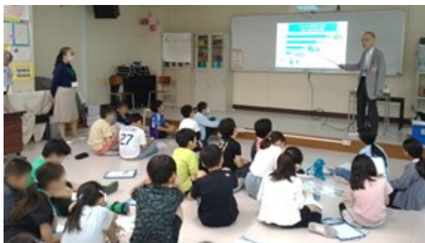
今年度実施した小学校での出前授業の様子