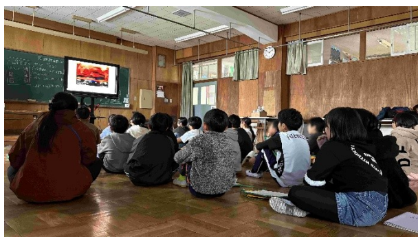
ビデオを見て温暖化の原因、影響、対策等を学ぶ

今年から総合の時間で環境を学び始めた4年生だったので、環境に対する関心がどうか心配をしましたが、積 極的に取り組んでいました。